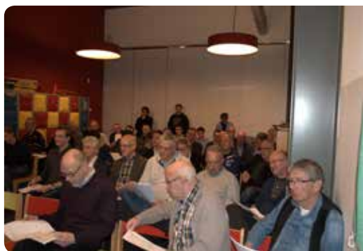
De jaarvergadering in 2016