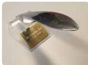
De Gouden Pen voor het beste clubblad in 1999