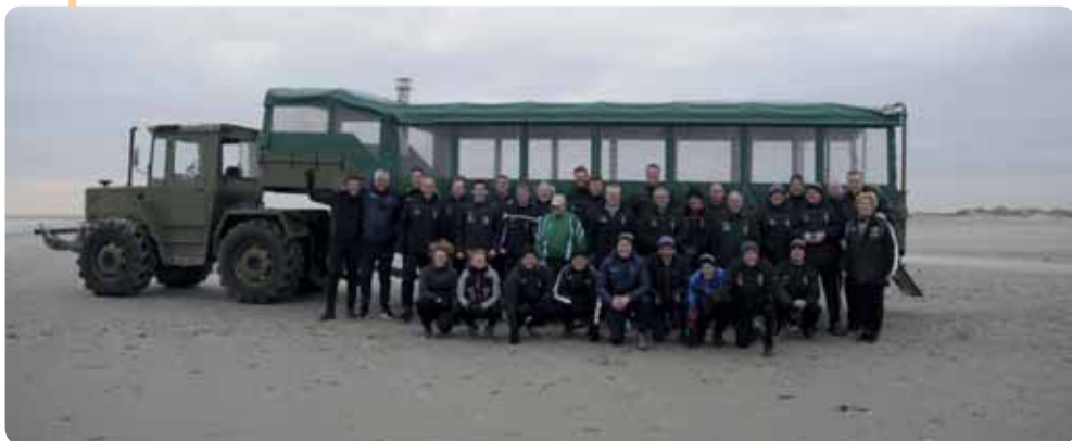
Op het uiterste puntje van het eiland