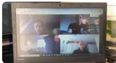
Op 14 mei werd een online clubavond over fit blijven georganiseerd.