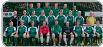
De selectie van FC Grootegast