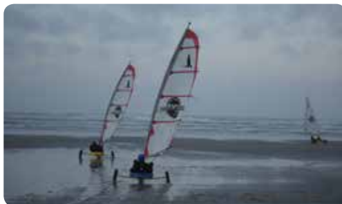
Op Ameland gaan we zelfs strandzeilen