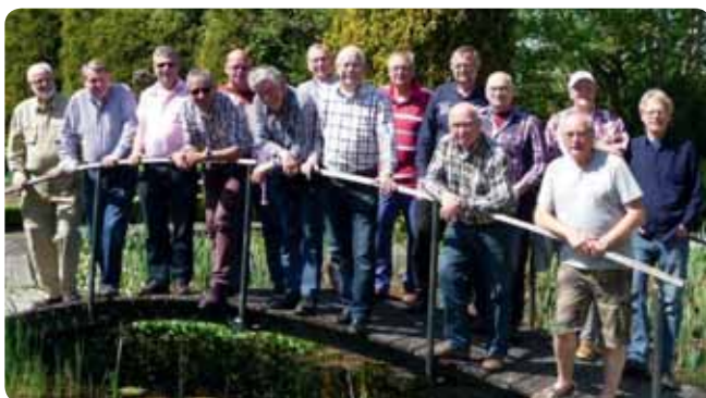
De mannen van de seniorensoos bijeen

Ook dit seizoen komen onze wat oudere leden en enkele oud-leden elke tweede maandag van de maand met veel plezier bijeen in het GRC-clubhuis. Van 14.00 – 16.00 uur wordt de actualiteit besproken en uiteraard vliegen de nodige anekdotes over tafel. Ook kan er gekeurd worden. En dat alles onder het genot van een hapje en drankje. Eenmaal per jaar gaat de groep ergens lekker eten. De seniorensoos is ontstaan na de succesvolle reünie in jubileumjaar 2008 en sinds die tijd (alweer zo'n 9 jaar) een vaste activiteit van onze vereniging. Wil je ook aansluiten? Je bent van harte welkom!