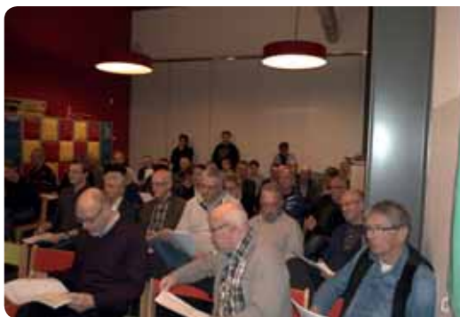
De jaarvergadering in 2016