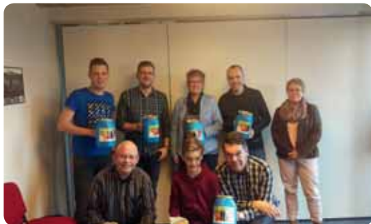
De collectanten bijeen