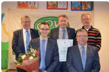
De jubilarissen en voorzitter bijeen.